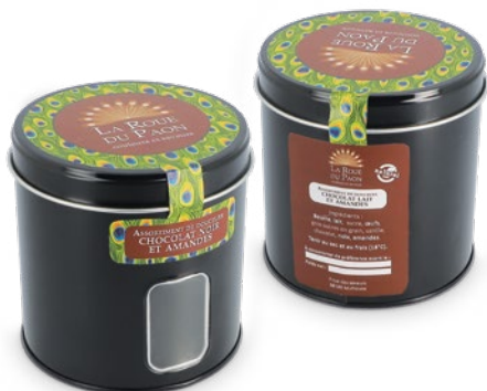
Boîte métal à fenêtre + étiquette personnalisée quadri (à coller)

ø75 x 115 mm réf.: I/BME75115NOFE Mini.: 72 P.U. HT : 3,7132 €