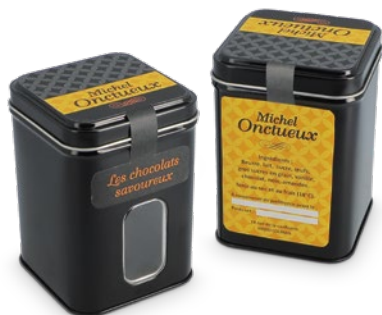
Boite métal à fenêtre + étiquette personnalisée quadri (à coller)

Dimensions boîte : 71 x 71 x 102 mm réf.: W/BME71102NOFEC Par: 960 - P.U. HT : 2,2099 € (max. 10 visuels*) Par: 480 - P.U. HT : 2,3143 € (max. 5 visuels*) Par: 192 - P.U. HT : 2,4013 € (max. 1 visuel) Mini.: 96 - P.U. HT : 2,5057 € (max. 1 visuel)