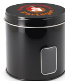
Boîte métal ronde à fenêtre Impression quadri sur couvercle

ø100 x 102 mm réf.: I/BME100102NOFE Mini.: 96 P.U. HT : 4,4719 €