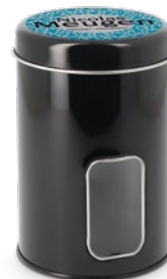
Boîte métal ronde à fenêtre Impression quadri sur couvercle

ø75 x 115 mm réf.: I/BME75115NOFE Mini.: 72 P.U. HT : 3,7132 €