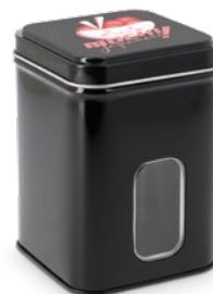
Boite métal carrée à fenêtre Impression quadri sur couvercle

71 x 71 x 102 mm réf.: I/BME71102NOFE Mini.: 96 P.U. HT : 3,5497 €