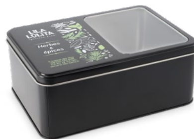
Boite métal rectangulaire à fenêtre Impression quadri sur couvercle

203 x 141 x 83 mm réf.: I/BME20314183NOFE Mini.: 90 P.U. HT : 5,3593 €