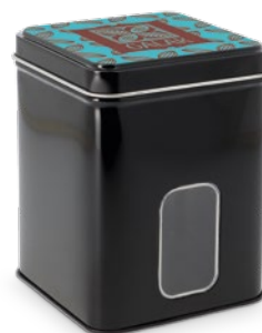
Boite métal carrée à fenêtre Impression quadri sur couvercle

87 x 87 x 115 mm réf.: I/BME87115NOFE Mini.: 96 P.U. HT : 3,8559 €