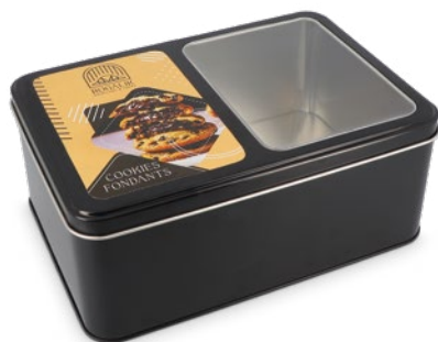
Boite métal à fenêtre + étiquette personnalisée quadri (à coller)

203 x 141 x 35 mm réf.: I/BME20314135NOFE Mini.: 48 P.U. HT : 5,3767 €