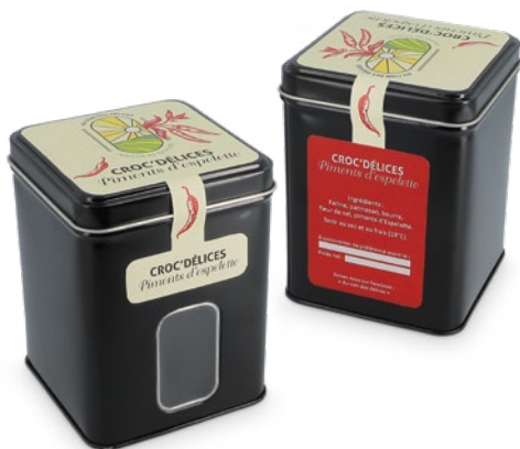
Boite métal à fenêtre + étiquette personnalisée quadri (à coller)

71 x 71 x 102 mm réf.: I/BME71102NOFE Mini.: 96 P.U. HT : 3,5497 €