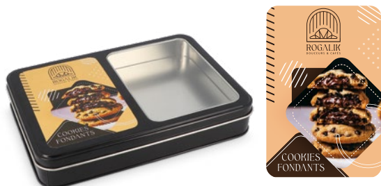
Boite métal à fenêtre + étiquette personnalisée quadri (à coller)

Dimensions boîte : 203 x 141 x 35 mm réf.: W/BME20314135NOFEC Par: 960 - P.U. HT : 3,0625 € (max. 10 visuels*) Par: 480 - P.U. HT : 3,2017 € (max. 5 visuels*) Par: 192 - P.U. HT : 3,4105 € (max. 1 visuel) Mini.: 96 - P.U. HT : 3,7063 € (max. 1 visuel)