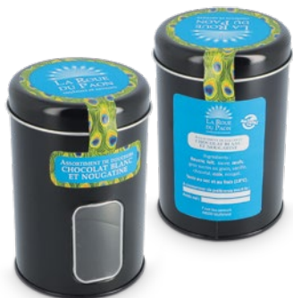
Boîte métal à fenêtre + étiquette personnalisée quadri (à coller)

Dimensions boîte : ø75 x 115 mm réf.: W/BME75115NOFEC