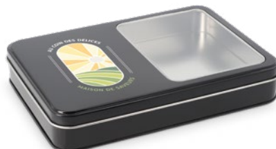
Boite métal rectangulaire à fenêtre Impression quadri sur couvercle

203 x 141 x 35 mm réf.: I/BME20314135NOFE Mini.: 48 P.U. HT : 5,3767 €